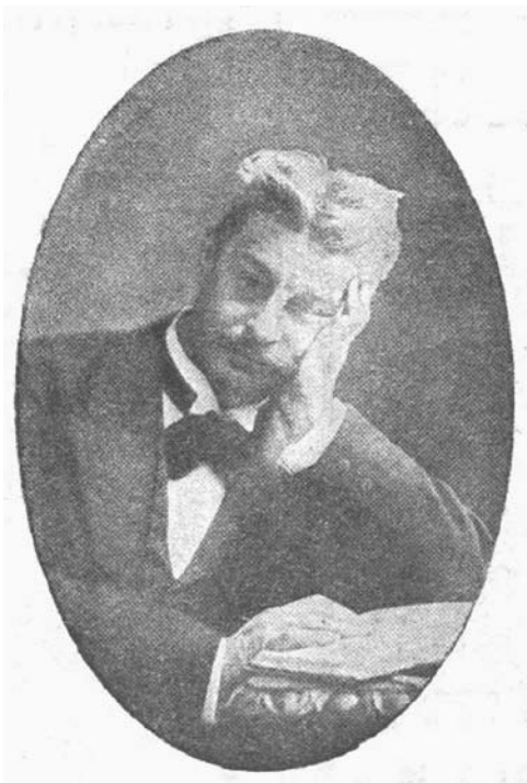
En temmelig træt Georg Brandes. Foto fra Tilskueren, Februar 1912 med titlen "Festskrift til Georg Brandes".

Når Søren Kierkegaards insisterer på "Hiin Enkelte", er det tilsyneladende et udtryk for en ekstrem individualistisk selvoptagethed. Men kun tilsyneladende. Hans filosofiske forfatterskab er på den ene side udsprunget af en egenartet og vel også temmelig aparte livsskæbne: "Man bliver ikke digter ved den pige, man fik, men ved den, man ikke fik". Men Kierkegaards forfatterskab er ikke reducerbart til denne livsskæbne. Det stikker dybere end hans egen åndelige selvkredsen. Det går så meget i dybden, at det kan tale til alle. Det handler om os alle. Grunderfaringerne er de samme. Angst er angst. Håb er håb. Liv er liv. Død er død. Frelse er frelse.